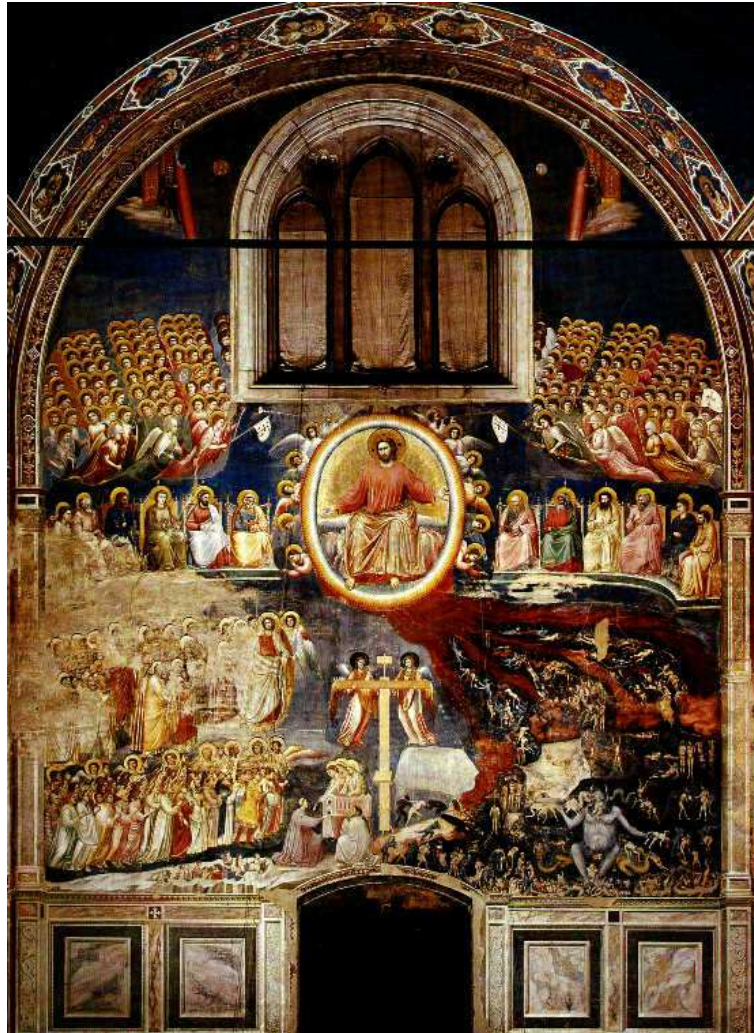
Giudizio Universale- Opera di Giotto-Padova- Cappella degli Scrovegni

Chi vive già adesso il Signore Gesù, non sarà giudicato. Chi crede in me non va incontro al giudizio